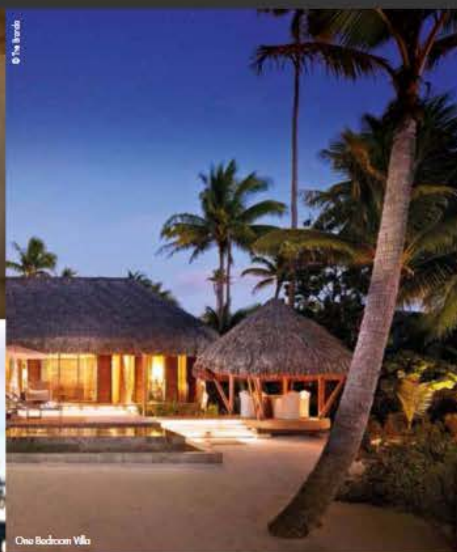
One Bedroom Villa