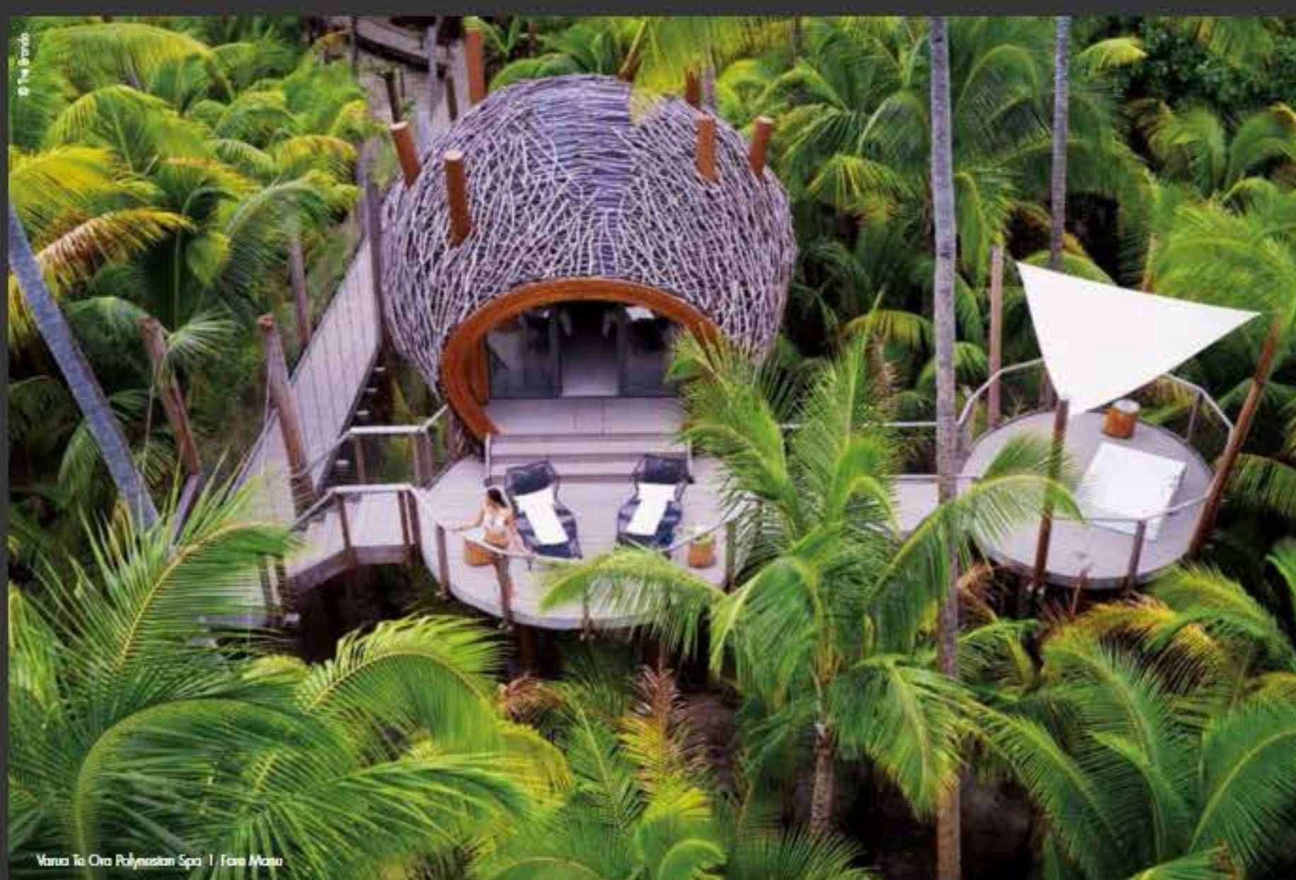
Varua Te Ora Polynesian Spa | Fare Manu