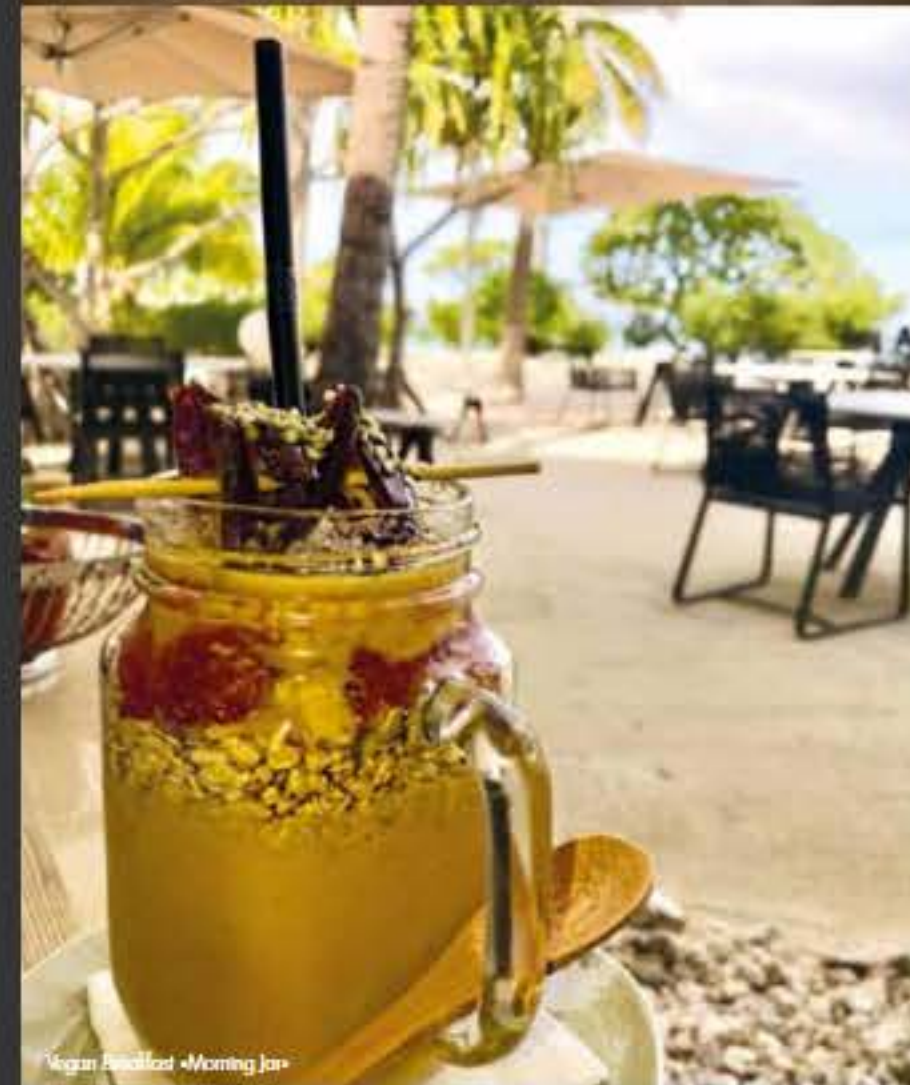
Vegan Beachbar • Morning Jar