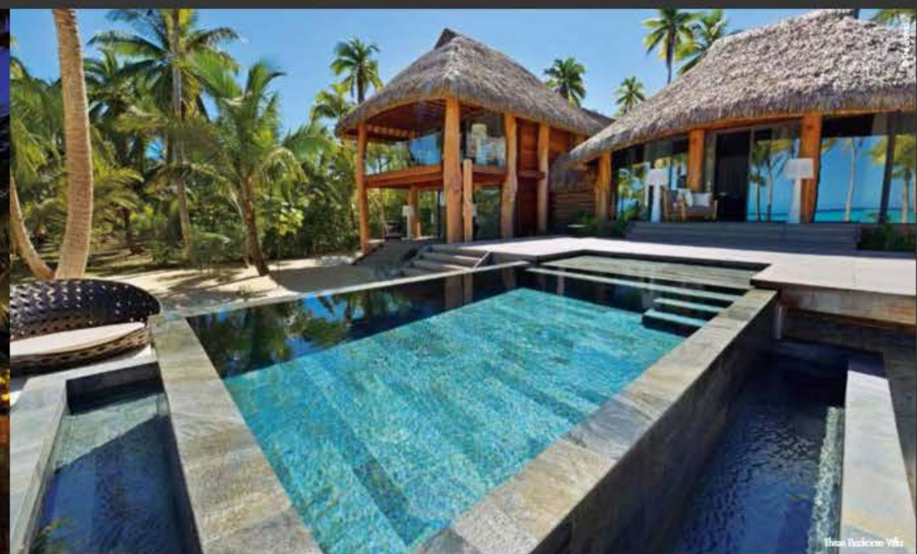
Three Bedroom Villa