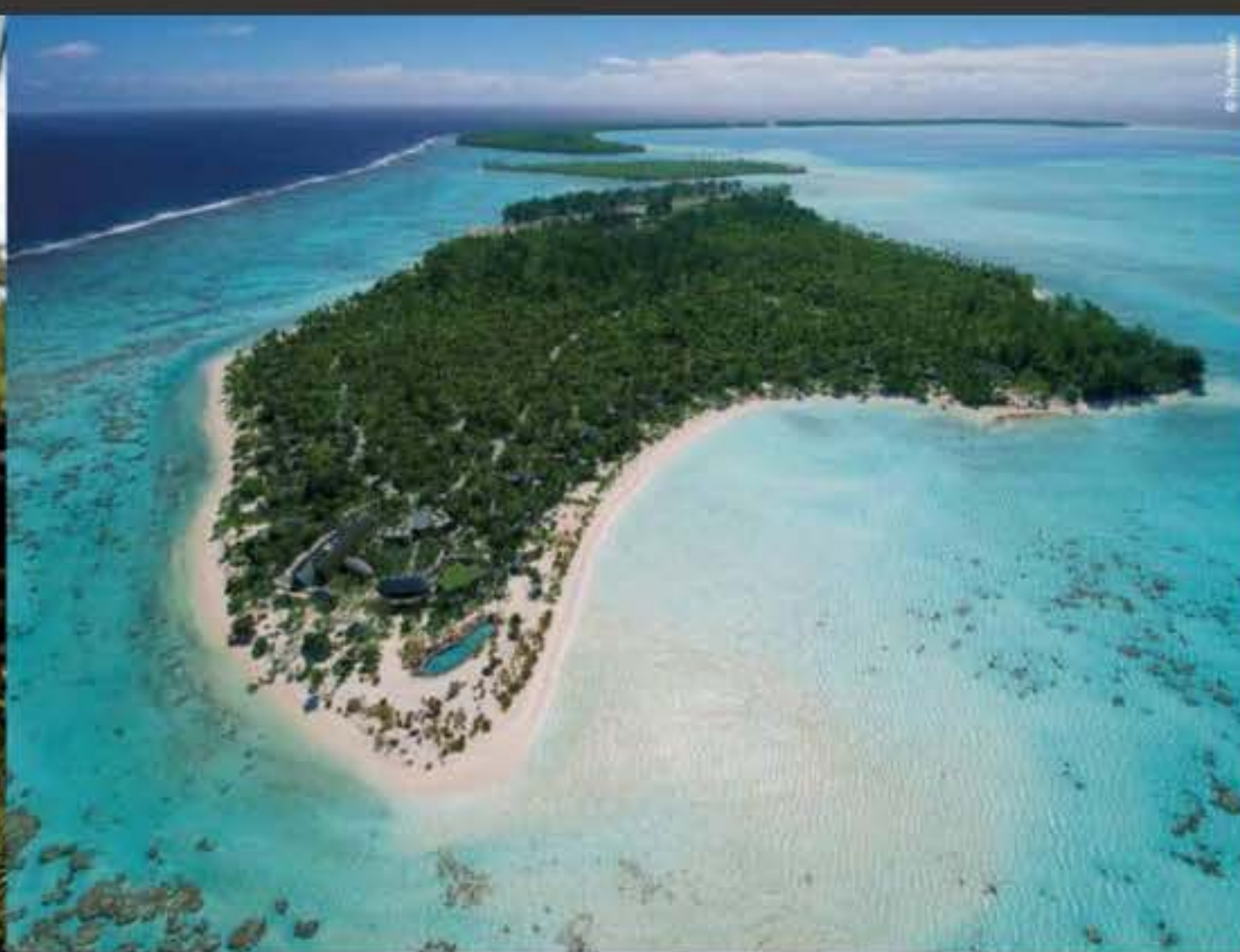
Tetiaroa Private Island French Polynesia