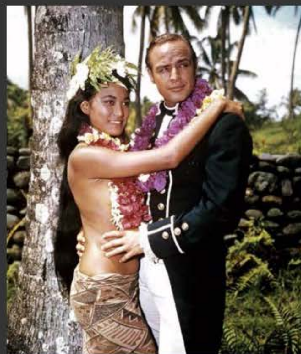
Tarita Teriipaia and Marlon Brando on the set of Mutiny on the Bounty (1962)