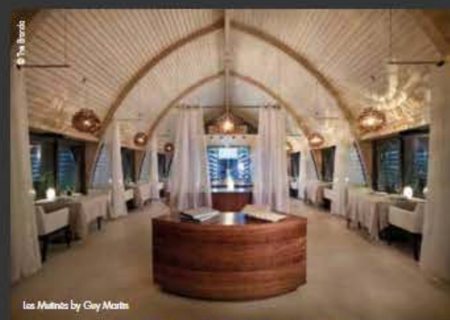
Las Mutinés by Guy Martin