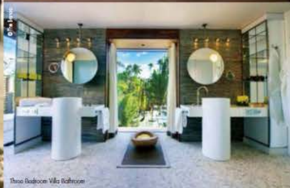
Three Bedroom Villa Bathroom