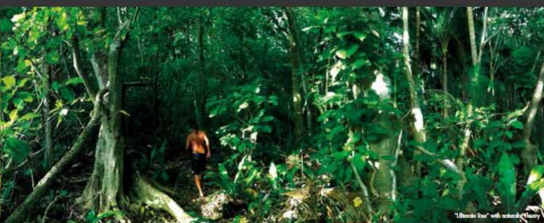
"Ultimate Tour" with naturalist Thierry